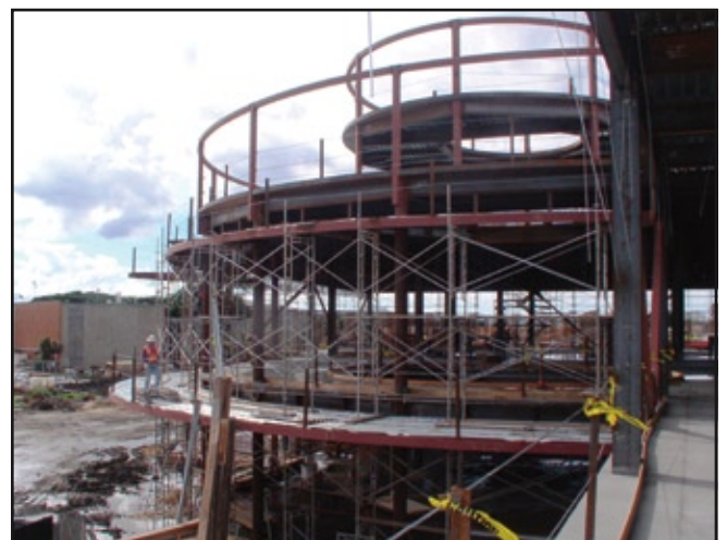
Un vestíbulo de dos pisos, con forma de atrio, les dará la bienvenida a los visitantes en el nuevo Centro de Recursos para el Aprendizaje (Biblioteca).