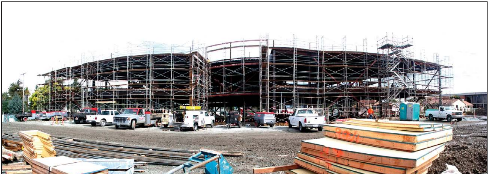
El Centro de Recursos para el Aprendizaje (Biblioteca) de $19 millones y 68,000 pies cuadrados está ubicado en la esquina de las avenidas Homestead y Central.