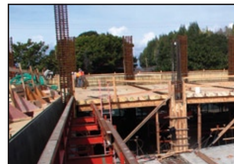
Construcciones y mejoras a lo largo del campus traerán a Hartnell al siglo 21.

La siguiente junta del comité está planeada para el 24 de Octubre a las 3 pm en la sala de juntas del Edificio de Salón de Clases/Administración (ESCA). El público está invitado para asistir. Para más información, llame a la Oficina del Presidente al (831) 755-6900.