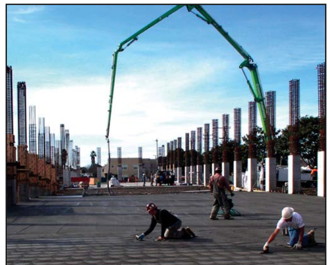
La nueva Estructura del Estacionamiento, la cual abre pronto, proporcionará espacios para 1,177 vehículos.