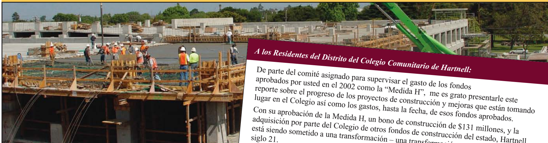
La Estructura de Estacionamiento de tres niveles está ubicada en la calle Central Avenue frente al Parque Central.